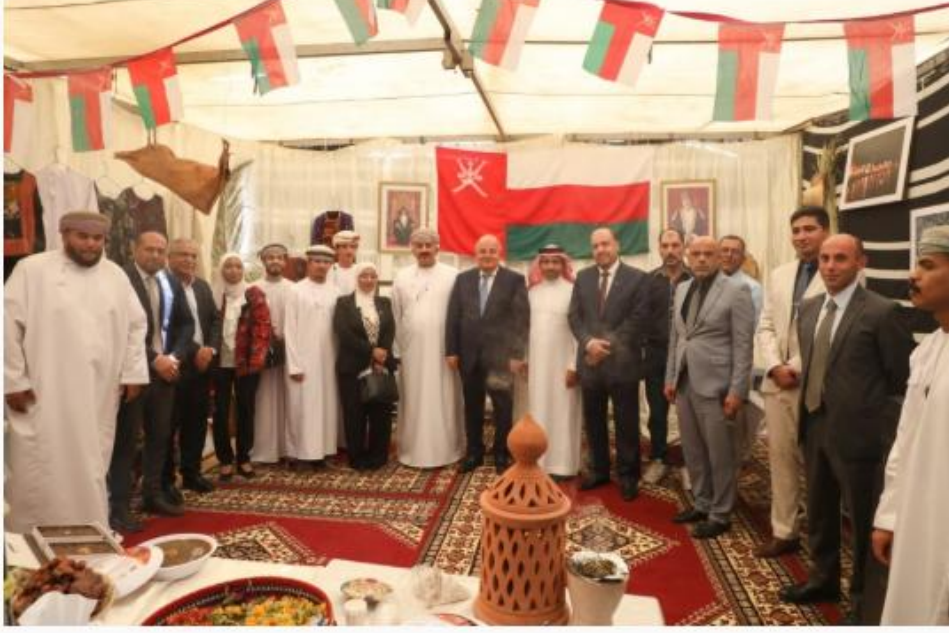
الشريط الإخباري :

خبر و صورة | 2026-04-27 | 01:57 pm - الإثنين