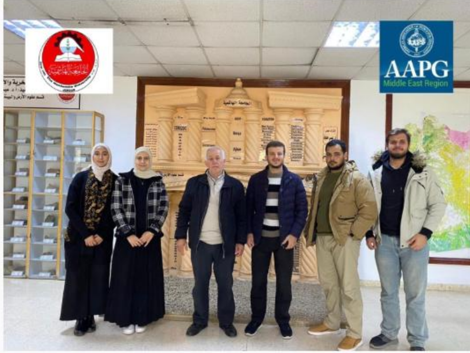
الشريط الإخباري :

خبر و صورة | 2026-04-22 | 01:48 pm - الأربعاء