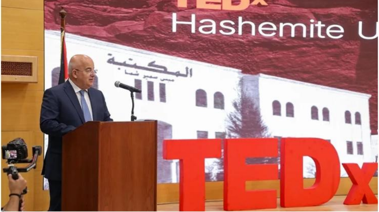
انطلاق فعاليات مؤتمر "تيدكس" في الجامعة الهاشمية